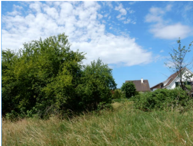
Abbildung 4: Foto der Hecke mit der umgebenden Fettwiese aus dem Naturinventar 2017.

Es gibt neu ein Baubegehren auf dieser Bauparzelle. Daher ist eine Abklärung auch für die Gemeinde wichtig. Die Grösse der Hecke entspricht tatsächlich den Mindestanforderungen einer schützenswerten Hecke nach der kantonalen Verordnung (Grösse und mehr als 50% einheimische Gehölze). Dies wurde bereits im Naturinventar 2017 so festgehalten. Daher muss bei einem Eingriff in dieses Heckenobjekt ein angemessener Ersatz geleistet werden. Dieser Ersatz sollte möglichst auf derselben Parzelle erfolgen (z.B. Hecke entlang Parzellengrenze). Das Ersatzobjekt wird durch die Gemeinde bewilligt.