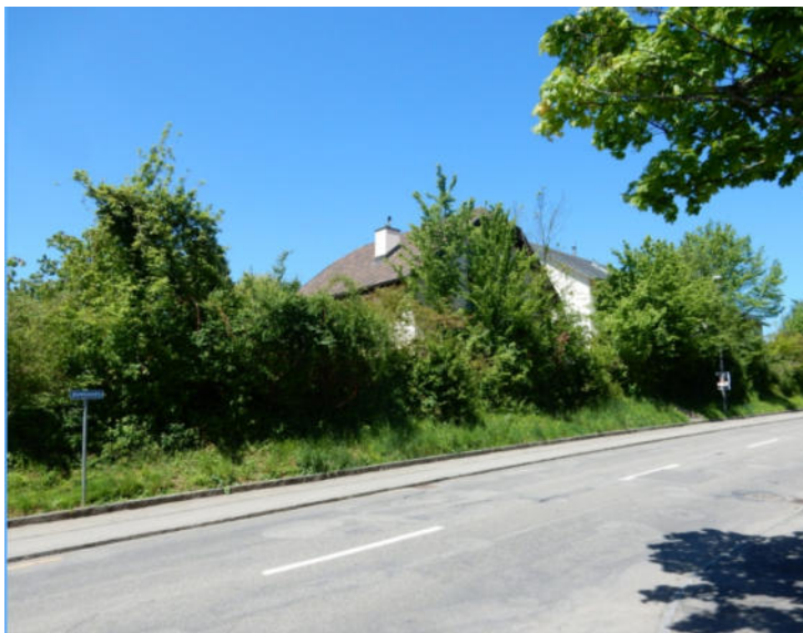
Abbildung 1: Aktuelles Luftbild 2026 der Hecke mit Inventarnummer auf Parzelle 482. Abbildung 2: Foto der Hecke mit Saum aus dem Naturinventar 2017.

Für einen barrierefreien Zugang zum Kindergarten soll in der Böschung eine Rampe gebaut werden. Dabei muss in die Hecke eingegriffen und wird eine Lücke von vermutlich ca. 10-15m entstehen. Aufgrund des Status als Inventarobjekt wird sich die Gemeinde überlegen, wie der Heckenersatz zu erfolgen hat.