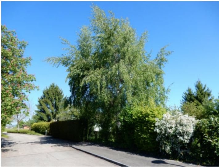
Abbildung 5: Foto der beiden jungen Birken im Naturinventar 2017.