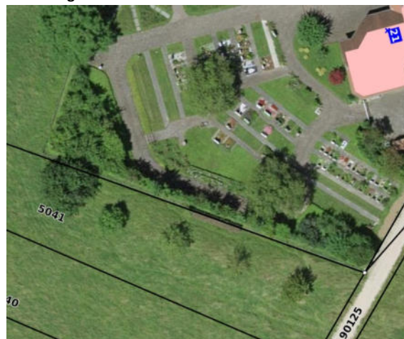
Abbildung 11: Aktuelles Luftbild 2026 der oberen Hecke.