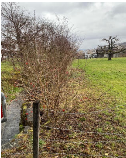
Abbildung 6: Aktuelles Foto des Ufergehölzes auf Parzelle 90090.

Der Marchbach mitsamt Ufergehölz wurde am 7.6.2011 als rechtsgültige Naturschutzzone bezeichnet (RRB Nr. 1218). Die damit festgelegten Gewässerbaulinie hat einen Abstand von 2m zur 5m breiten Naturschutzzone. Die Heckenzaunlinie fällt genau auf diese Gewässerbaulinie, da die Heckengrenze etwa in 3m Distanz zum Marchbachufer verläuft.