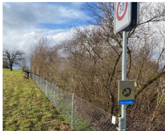
Abbildung 9: Obere Hecke auf dem Friedhof.