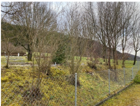
Abbildung 8: Untere Hecke auf dem Friedhof.

Die beiden Mittelhecken auf dem Friedhof (Parzelle Nr. 546) wurden zum Zeitpunkt des Naturinventars 2017 noch nicht aufgenommen. Vermutlich konnte die Hecke am oberen Rand aufgrund der kleineren Dimension noch nicht als Hecke identifiziert werden und wurde die Hecke im unteren Teil neben dem Weiher erst später gepflanzt.