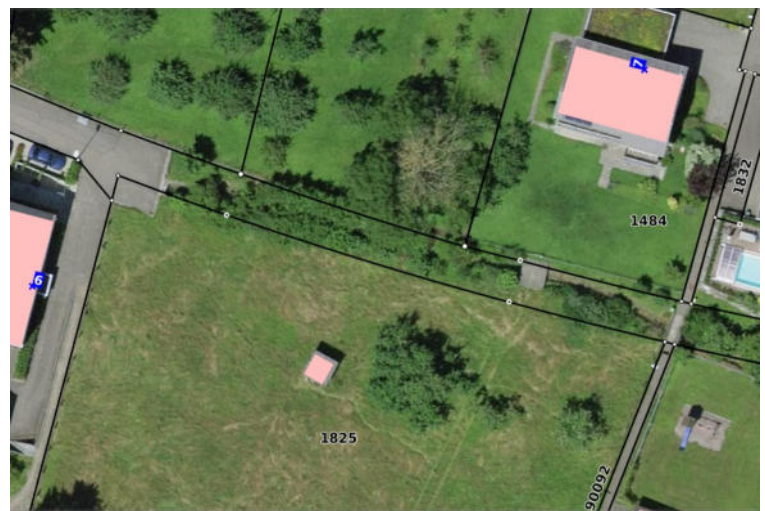
Abbildung 7: Aktuelles Luftbild mit dem Abschnitt des Marchbachs zwischen dem Rebenweglein und «Im Dofel».