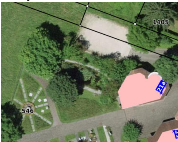
Abbildung 10: Aktuelles Luftbild 2026 der unteren Hecke.